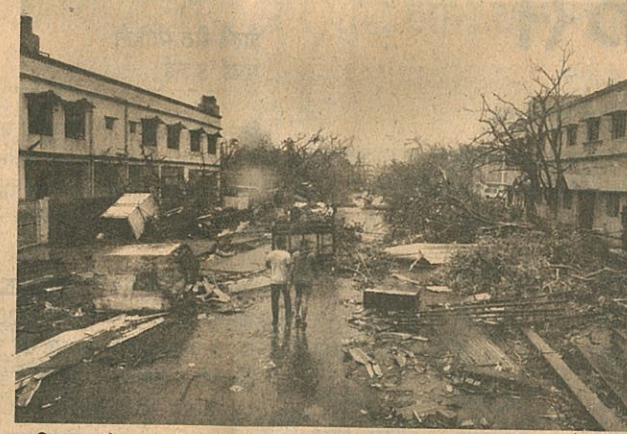
■ विद्युत और दूरसंचार ढांचे को भारी नुकसान ■ हजारों कच्चे मकान ध्वस्त, सड़क संपर्क कटा

दिलीप सतपथी, जयाजित दास और निर्माल्य बेहड़ा भुवनेश्वर, 3 मई